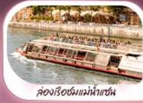
ล่องเรือชมแม่น้ำแซน