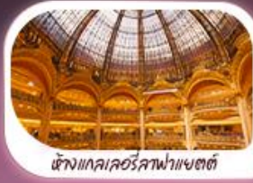
ห้างแกรนด์ปาเลอแห่งซตต์