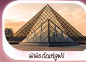
พิพิธภัณฑ์ลูฟร์